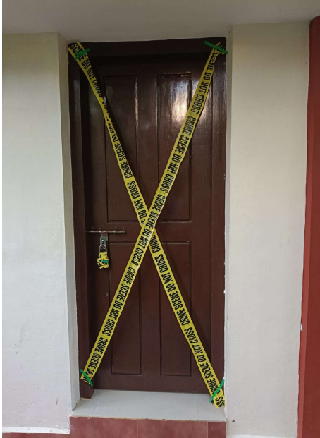
ചുരുട്ടി ബ്രദറൻ സഭാഹാൾ പൂട്ടിയ നിലയിൽ