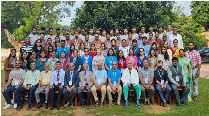
നിയോഗിച്ചു. അവർ ഞങ്ങളോടൊപ്പം നിരൂപാധികമായി പ്രവർത്തിച്ചു.