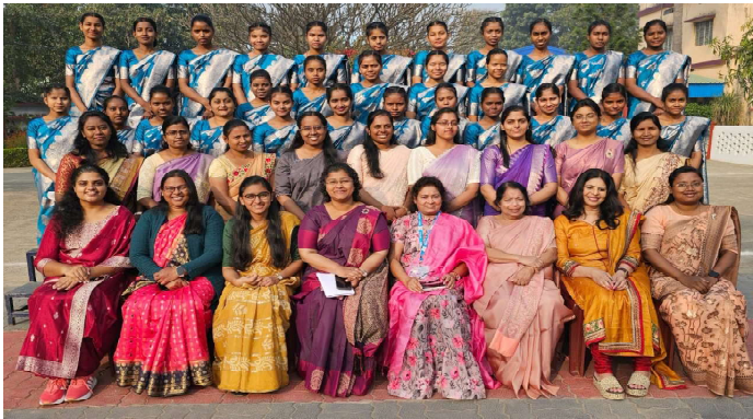
(തുടർച്ച പേജ് 3....)

വർഷങ്ങൾ കഴിയുമ്പോൾ, അദ്ദേഹത്തിന്റെ ശുശ്രൂഷ എമ്മാവുസ് ബൈബിൾ കോളേജ്, മുഡി ബൈബിൾ ഇൻസ്റ്റിറ്റ്യൂട്ട്, ഡാളസ് തിയോളജിക്കൽ സെമിനാരി തുടങ്ങിയ പ്രശസ്ത ബൈബിൾ കോളേജുകളിലേക്കുള്ള സന്ദർശനങ്ങളിലേക്ക് വികസിച്ചു. അദ്ദേഹത്തിന്റെ സാധനശക്തിയുള്ള സന്ദേശങ്ങൾ ഹൊയോ കോൺഫറൻസിന്റെ 40-ാം വർഷത്തിലേക്ക് അദ്ദേഹത്തിന് ക്ഷണം നേടിക്കൊടുത്തു. ശ്രദ്ധേയമായി, 2015 ലും 2019 ലും നടന്ന ഇന്റർനാഷണൽ ബ്രദർസ് കോൺഫറൻസിൽ മിഷനുകളുടെ പ്രാധാന്യത്തെക്കുറിച്ച് 109 രാജ്യങ്ങളിൽ നിന്നുള്ള സദസ്സിനെ അഭിസംബോധന ചെയ്തുകൊണ്ട് അദ്ദേഹം ഒരു പ്രഭാഷകനായിരുന്നു. 2023 ൽ ഫിലാഡൽഫിയയിൽ നടന്ന ഫിബ കോൺഫറൻസിൽ അദ്ദേഹം മുഖ്യ പ്രഭാഷണം നടത്തി.